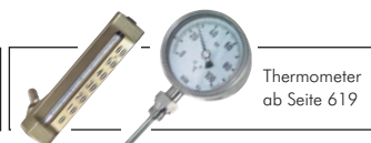
Thermometer ab Seite 619